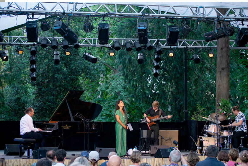
Un piano sous les arbres, édition 2022 Lunel-Viel (France)